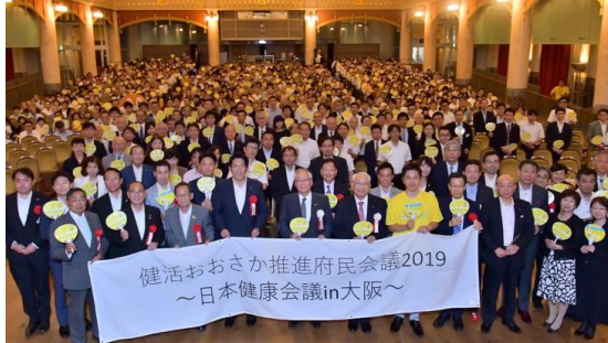
〈健活おおさか推進府民会議〉