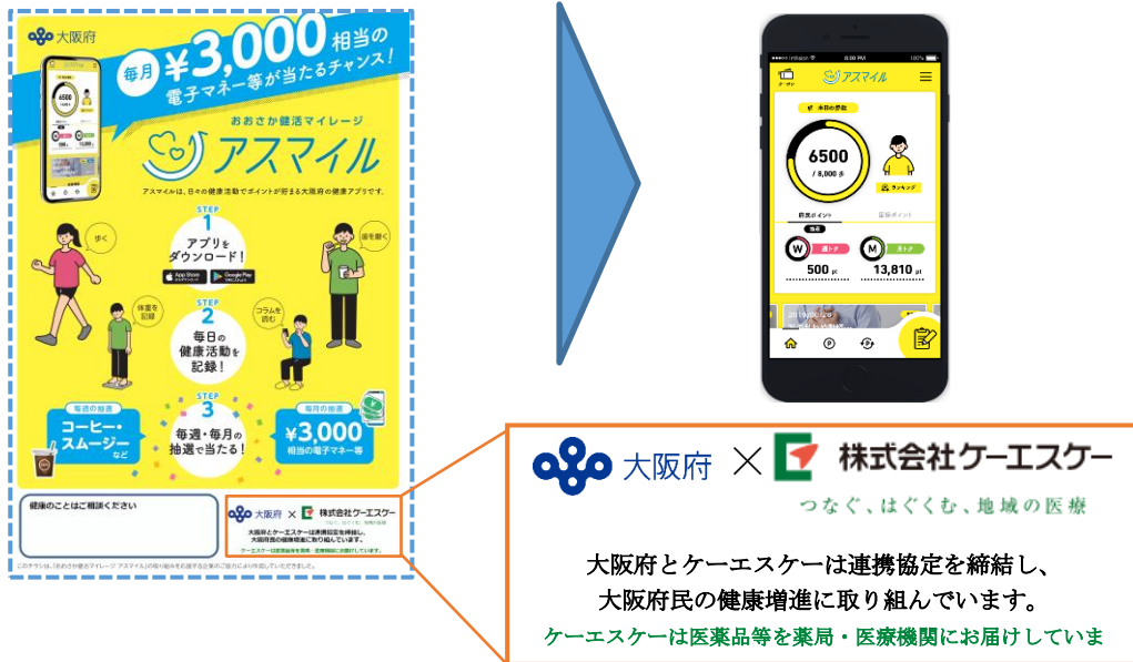
〈連携チラシの作成による「アスマイル」の利用促進〉

ケーエスケー営業担当者のネットワークにより、地域の薬局における健康アプリ「アスマイル」及び「健活10」の普及啓発を通じて地域住民の健康づくりを支援します。