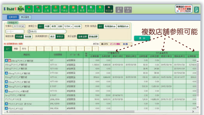
他店舗の在庫参照画面