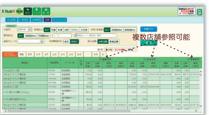
全店舗の在庫参照画面