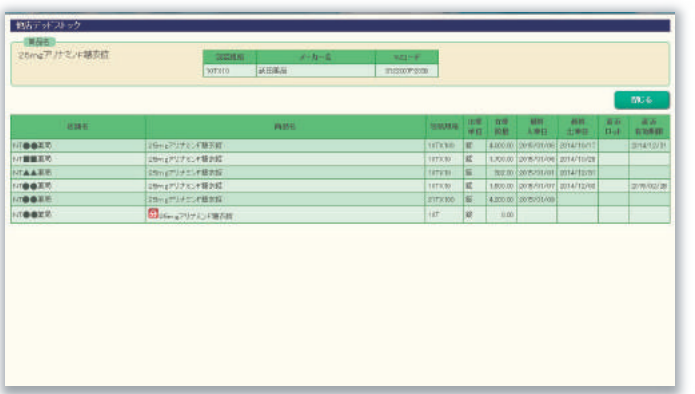
デッドストックに対しての他店舗状況